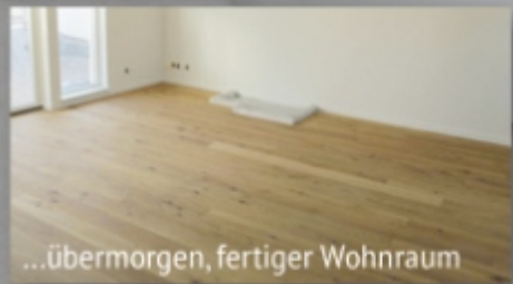
...übermorgen, fertiger Wohnraum

Belegereife für alle Beläge wie Parkett, Laminat, Vinyl nach 3 bis 21 Tage.