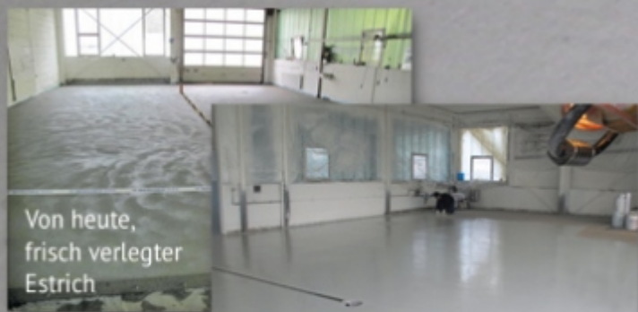
Von heute, frisch verlegter Estrich